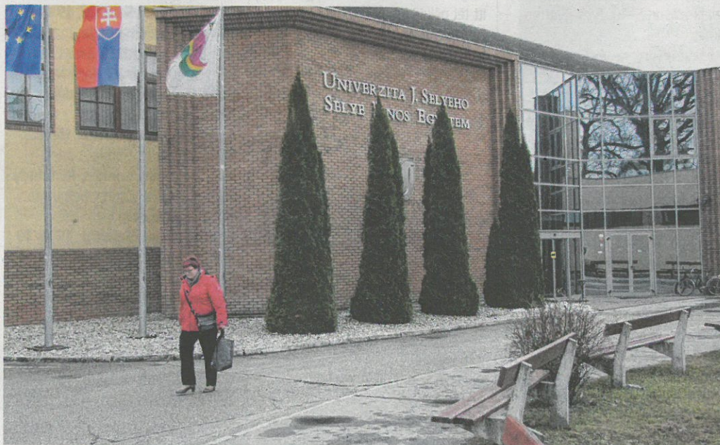
A Selye János Egyetem Szlovákia egyetlen magyar tannyelvű felsőoktatási intézménye, ahol három karon tanulhatnak a hallgatók.

– Ön, mint az egyetem új rektora, mit tart elsődleges feladatának?